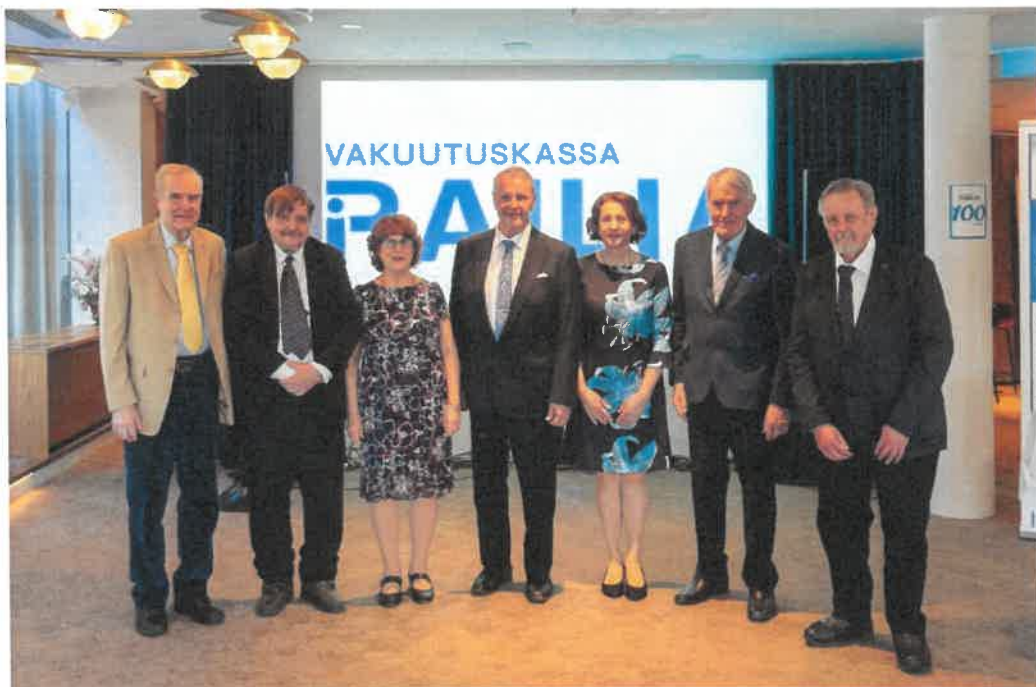
100 v juhlassa huomioitut kassan toiminnassa ansioituneet