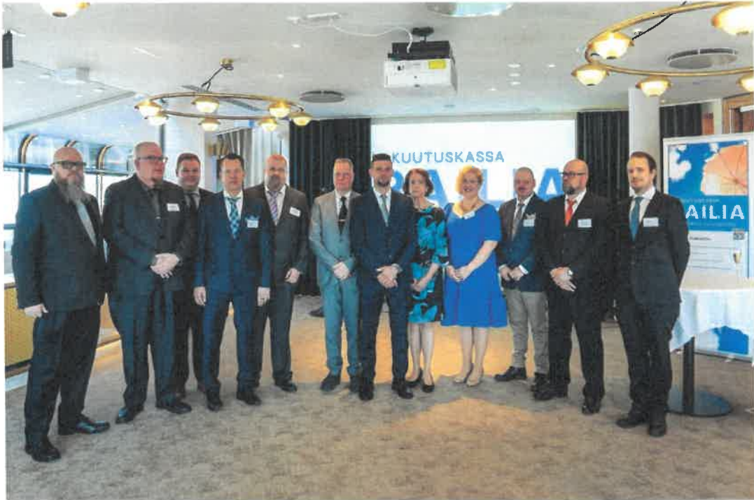
Vakuutuskassa Railia 100 v juhla 16.5.2025 kassan hallitus ja toimisto